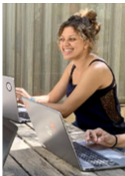
FemCoders. Factoría F5