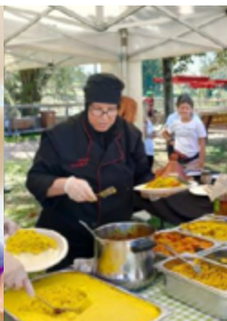
Dinem Plegats. Asociación Casal Claret