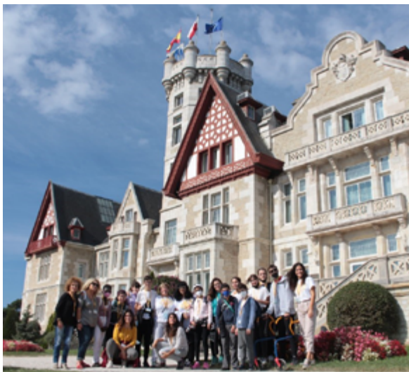
Fundación Blas Méndez Ponce