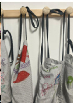
Transformando muebles. Organización Aires