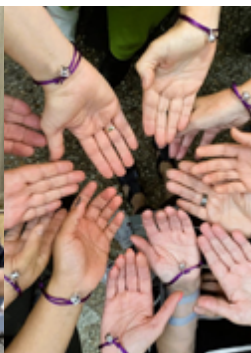
Espacio Mujer. Organización Atiempo