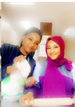
Chakula Kitamu. Organización Karibu