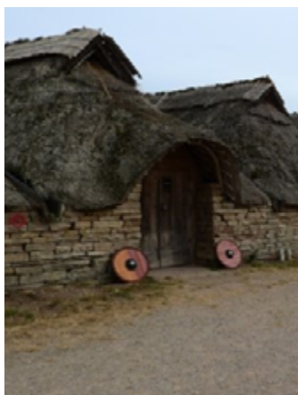
Centro de Tecnología Celtíbera de Tragacete